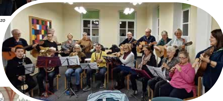
Gitarrengruppe und Bläsergruppe